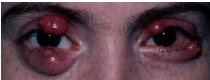
Figura 1. Paciente joven con chalaziones severos en ambos párpados. Figura obtenida de Silkiss et al. (10).

Silkiss et al. (10) también informaban de una gravedad variable entre los chalaziones en el párpado superior (PS) y en el inferior (PI), así como en la zona medial y en la temporal, en algunos casos, en el mismo paciente (Figura 1).